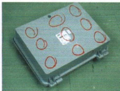
Figuras 1 e 2 – Caixa de polipropileno